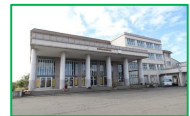
旭岡中学校 1,000m(徒歩13分)