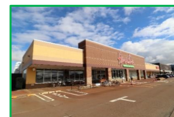
原信 長岡花園店 500m(徒歩7分)