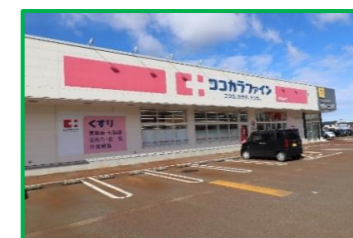
ココカラファイン 長岡花園店 550m(徒歩7分)