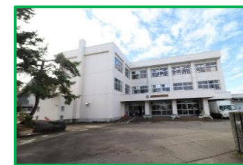
豊田小学校 1,000m(徒歩13分)